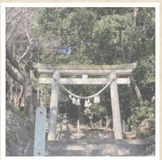
白山神社。湖を見守るように佇む。昔の人が組んだ石組みの参道や、急な階段に圧倒される。登りきった後は、...