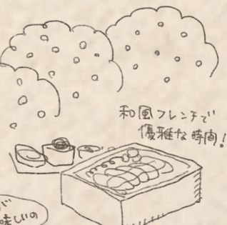
和風フレンチ! 優雅な時間!