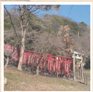
稲荷山。子供達の声が響く小学校の裏山。こんな風に駆け回れる裏山があるなんて、うらやましい!