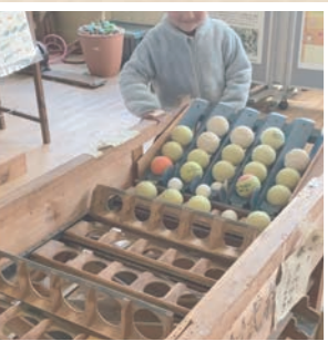
みかんの里資料館。見るだけでなく体験コーナーも。こちらは何をしているところでしょうか?

日本最大規模!! 11月頃から毎日、たくさんみかんが集まってくるよ!! 豊橋方面