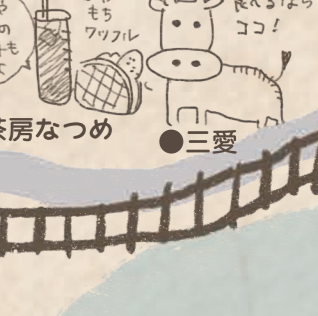
三ヶ日牛を育てるならココ!