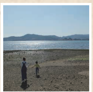
津々崎弁天。潮がひいているときは遠浅で、どこまでも走って行けるような気持ちになる。とても気持ち良い場所!